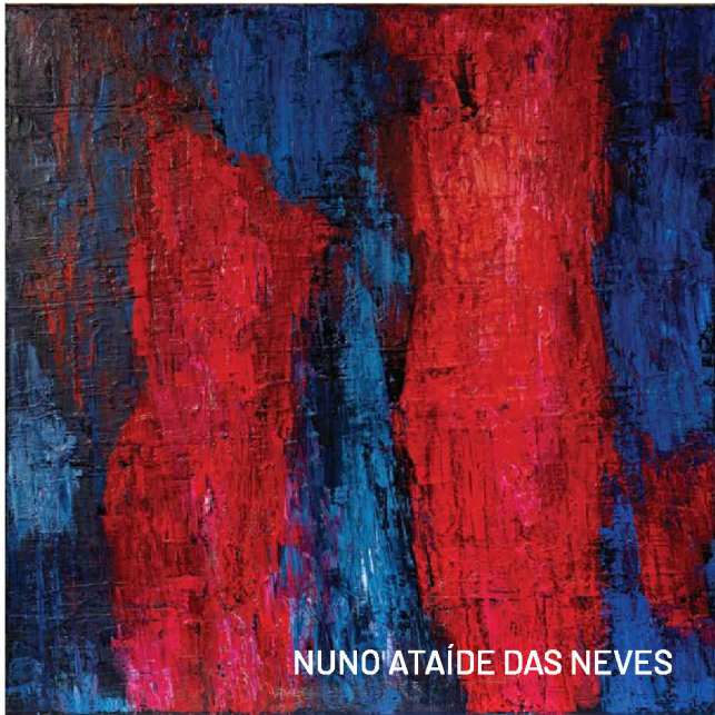
NUNO ATAÍDE DAS NEVES